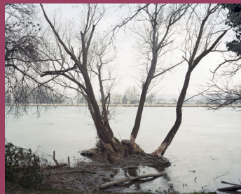
Emmanuelle Coqueray : Îlot , Vaulx-en-Velin, 2012. Tirage numérique contrecollé sur Dibond. 120 x 150 cm. Collection Ville de Vénissieux.

Possibilité de mise à disposition d'un car sous conditions