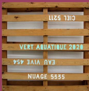
Jean Reudet : Le jardin des voleurs, Pan !... , 1992. Peinture acrylique sur palette en bois. 120 x 120 cm. Collection Ville de Vénissieux.